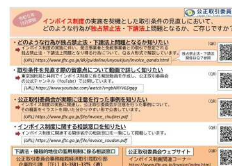
インボイスQ&Aの案内紙