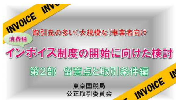
インボイスQ&Aの説明動画