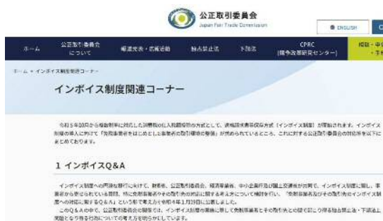
公正取引委員会ウェブサイト